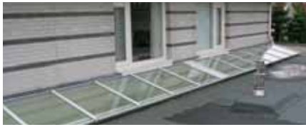
Toit pupitre contre mur (LDM)

L'assortiment Luxlight comprend 3 modèles de fenêtres de toit plat :