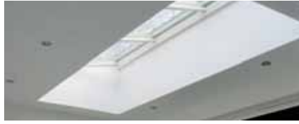
Toit pupitre indépendant (LDV)