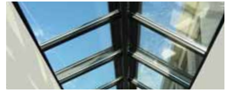
Toit en bâtière (ZD)